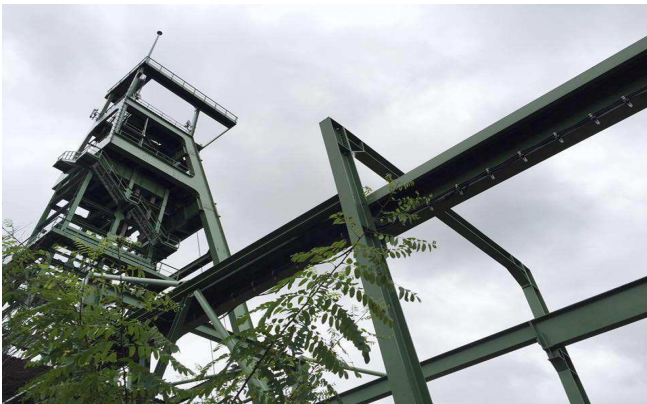
Bergwerk Heinrich Überraehr